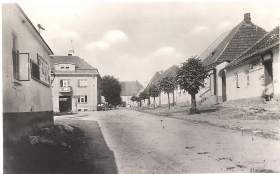
Pohled od Milíčova na horní stranu „městečka“. Všimněte si vchodu do obchodu u Wienerů. Fungoval až do doby, než byla otevřena prodejna Jednoty.

Je až neuvěřitelné, kolik pozitivních ohlasů mají starší dobové fotografie. Pár mi jich tu ještě pořád zůstává a tak se o ně rád podělím.