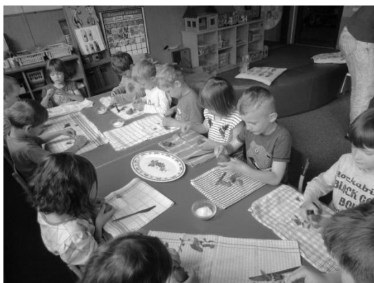
V MŠ děti jedly dřevěnou lžící staročeské jídlo. Na rozprostřené utěrce si děti pochutnaly na vařených bramborách ve slupce se solí a máslem.