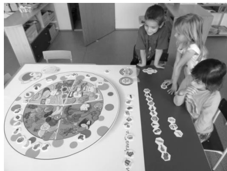
Děti sestavují výživový talíř.

Oslavujeme zdravěji – ovocem, ovocnými šťávami, buchtami bez krémů / tvarohové bábovky, perník